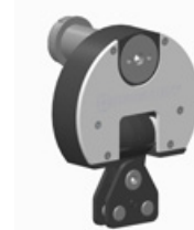
2 Messelement ASK-2