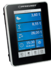
1 Electronique de pesage