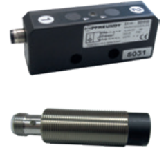
3 Capteurs de proximité