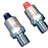
2 Capteurs de pression