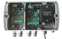
3 Capteur d'inclinaison dans le boîtier de raccordement