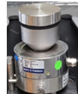
2 Élément de mesure ARK-2