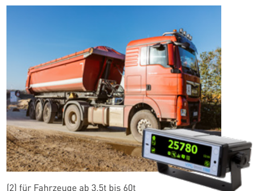
(2) für Fahrzeuge ab 3,5t bis 60t