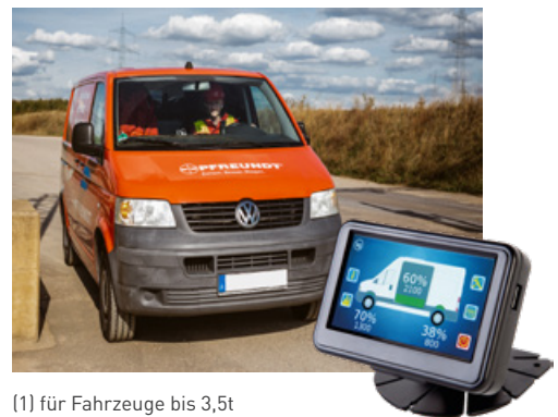
(1) für Fahrzeuge bis 3,5t