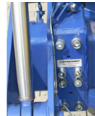
2 Elément de mesure FLW-1