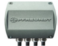
3 Système de mesure d'inclinaison