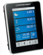
1 Electronique de pesage