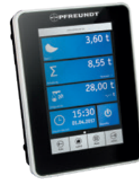
1 Electrónica de pesaje