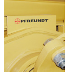
2 Elemento de medición DW-3