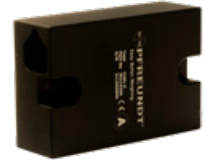
3 Winkelsensor SWT