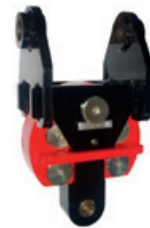
2 Messelement BGW-1