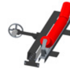
2 Wiegerahmen BW-2