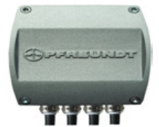
3 Système de mesure d'inclinaison