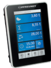
1 Electronique de pesage