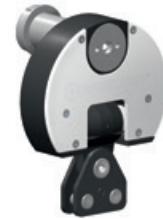
2 Elément de mesure ASK-2