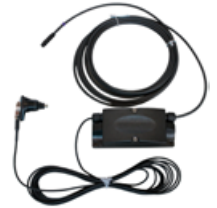
3 Module radio