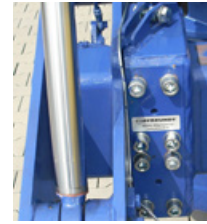
2 Elément de mesure FLW-1