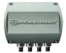
3 Système de mesure d'inclinaison