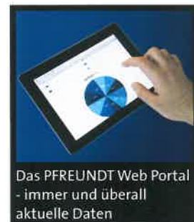
Das PFREUNDT Web Portal - immer und überall aktuelle Daten

Das PFREUNDT Web Portal ist die internetbasierte Alternative für die Datenpflege und -übertragung. Per Web-Browser stehen Ihnen die Daten auf Tablet-PC, Smartphone und PC jederzeit und überall zur Verfügung.