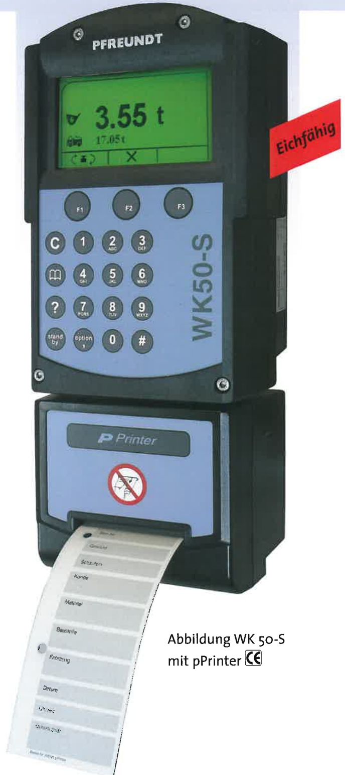
Abbildung WK 50-S mit pPrinter

Durch einfachen Austausch der Bedienelektronik aufrüstbar auf die WK 50.