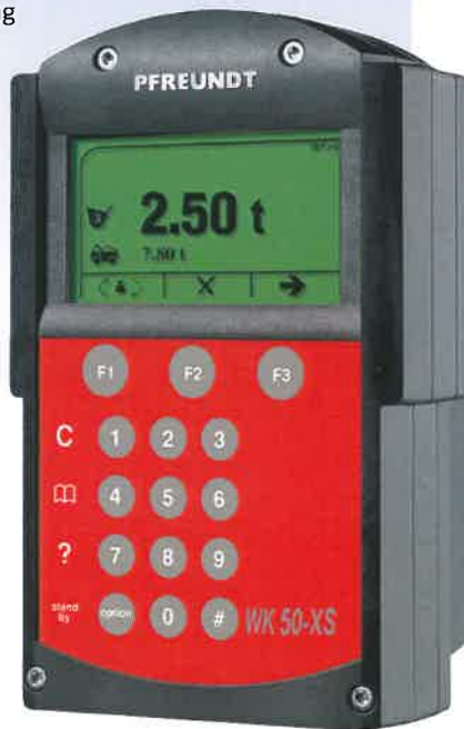
Abbildung WK 50-XS

(* ) für die Aufrüstung auf WK 50-S oder WK 50 zum eichpflichtigen Einsatz ist ggf. ein Drucksensor mit Temperaturkontrolle erforderlich/ nachzurüsten)