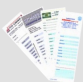
Cartellini di pesatura