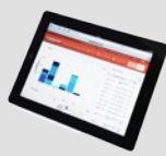
PFREUNDT Web Portal