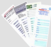
Cartellini di pesatura