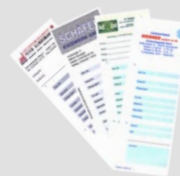
Cartellini di pesatura