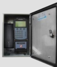
Cassetta porta elettronica