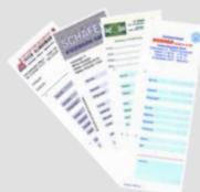
Cartellini di pesatura