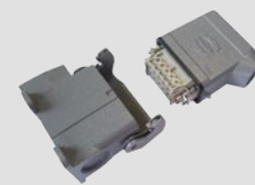
Collegamenti a spina