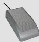
Interruttore a pedale