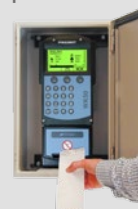
Cassetta porta elettronica