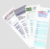
Cartes de pesage