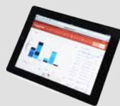
PFREUNDT Web Portal