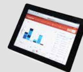
PFREUNDT Web Portal