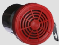
Externer akustischer Signalgeber