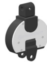
2 Messelement KRW-2