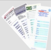
Cartellini di pesatura