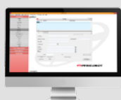
Collegamento al computer