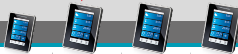
Non omologabile WK60-XS