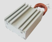
Grijanje rasklopnog ormara