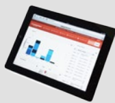
PFREUNDT Web Portal